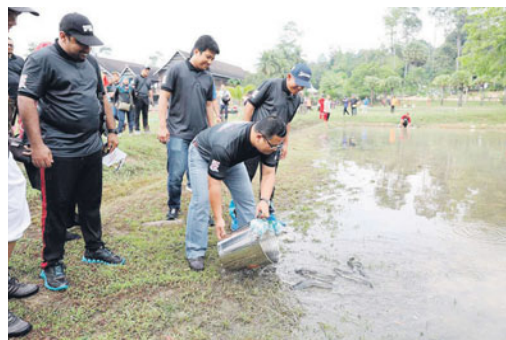
Bagi melepaskan ikan keli bagi acara redah bendang tangkap ikan keli.

Menurutnya, hanya 30 orang peserta dibenarkan berada dalam setiap pasukan zon MPP. Katanya, terdapat empat kategori yang dipertandingkan di Karnival Sukan Bendang ini iaitu sukan rakyat, sukaneka, kanak-kanak dan