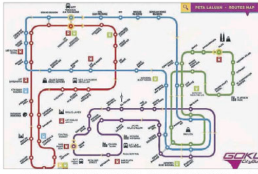
■吉隆坡免费巴士目前有4条川行路线，川行于市中心尤其是旅游景点区为多。