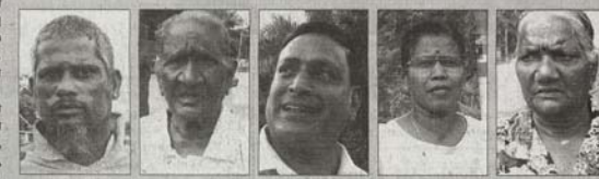
கங்காதரன் தங்கப்ப பிரபா மணியால் மானியம்மா

குறிப்பாக இங்கு ஐந்து வரிசைகளைக் கொண்ட குடியிருப்புப் பகுதிக்குச் செல்லும் சாலைகளில் மின் விளக்குகள் பொருத்தப்பட்டவில்லை என்பதுடன் இங்குள்ள சாலைகள் பல ஆண்டுகளாக மறு சீரமைப்புச் செய்யப்படாததன் காரணமாக தற்போது குண்டும் குழியுமாக காட்சியளிக்கிறது. தவிர இக்கிராமத்தை ஓட்டியுள்ள கேரித்தீவின் பிரதான சாலையில் வாகனங்களுக்கான வேகக் கட்டுப்பாட்டு மேடுகளை, வளைவுகளை அமைக்க வேண்டும் என மேலும் கூறினார். இங்குள்ள குடியிருப்பாளர்களாகிய நாங்கள் மேற்கண்ட விவகாரம் தொடர்பில் பல தடவை தொகுதி சட்டமன்ற உறுப்பினரிடம் புகார் தெரிவித்திருந்தும் செவிடின் கரதில் ஊதிய சங்கு போன்ற கதையாகவே இருந்து வருகிறது. அரசியலில் தங்களின் பதவியை தக்க வைத்துக்கொள்