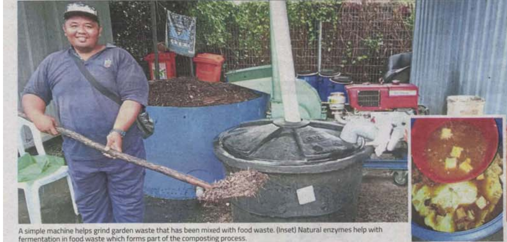
A simple machine helps grind garden waste that has been mixed with food waste. (Inset) Natural enzymes help with fermentation in food waste which forms part of the composting process.

Provided for client's internal research purposes only. May not be further copied, distributed, sold or published in any form without the prior consent of the copyright owner.