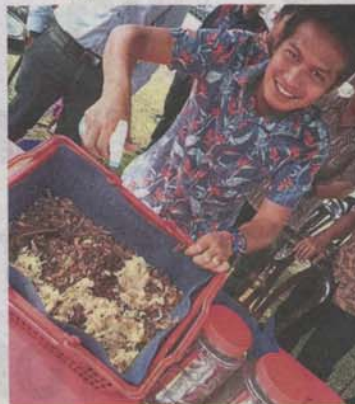
Nazir says MPKJ employs the Takakura method for food composting, using materials sourced from home.

Bandar Baru Bangi residents are used to recycling and willing to participate in pilot project, says RA