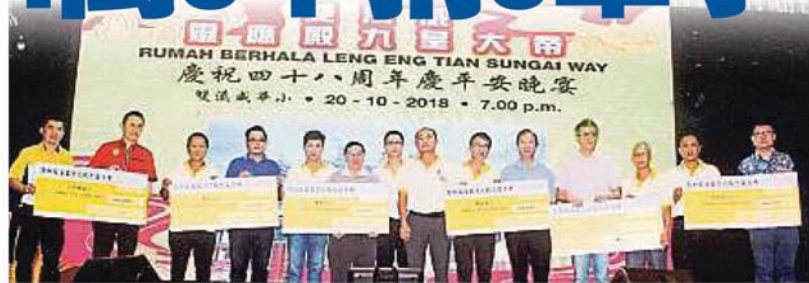
▲双溪威灵应殿九皇大帝在48周年平安晚宴上颁发模拟支票给6所华小的代表。