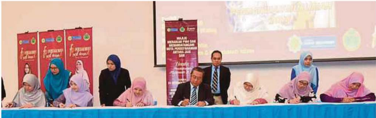
FINALIS PM4 menandatangani nota persefahaman dengan JAIS