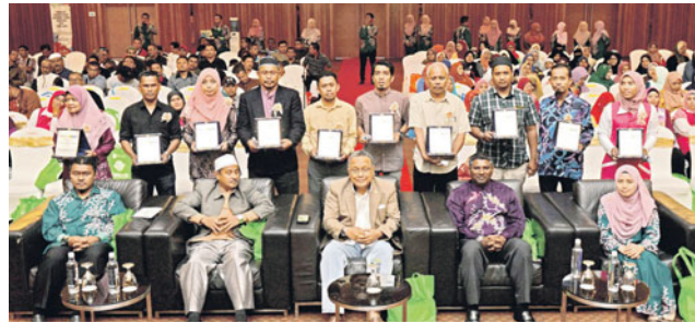
10 usahawan asnaf yang menerima pengiktirafan atas kejayaan mereka membina empayar perniagaan bergambar bersama barisan tulang belakang Teras dan LZS sempena Program Tuas 2018.

"Suntikan motivasi juga diberikan kepada mereka dengan kita bawa ikon-