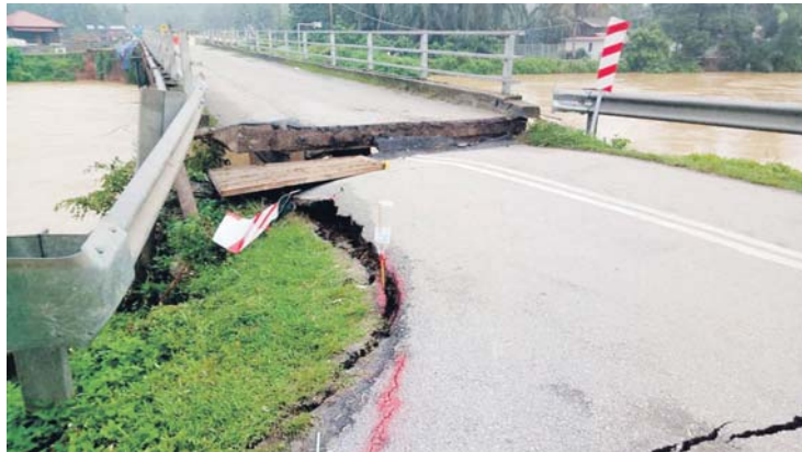
Keretakan serius pada jambatan yang menghubungkan penduduk di Jalan Kampung Rantau Panjang ke sekolah dan pekan berhampiran.

BESTARI JAYA - Jambatan menghubungkan Jalan Kampung Rantau Panjang, di sini terpaksa ditutup sejak malam, semalam susulan keretakan akibat mendapan serius.