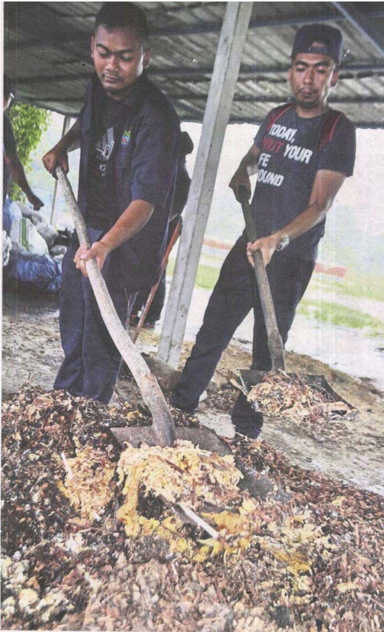
Manual process: Kajang Municipal Council workers mixing food and garden waste to be turned into compost.

Provided for client's internal research purposes only. May not be further copied, distributed, sold or published in any form without the prior consent of the copyright owner.