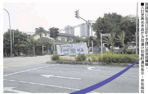
哈拉班路和17区及19区的十字路口处张贴横幅。

他坦言, 这项改道计划在拟成前, 这些在住宅区的道路确实因道路狭窄而常常引起碰撞事故, 因此, 经过居民的投诉和建议, 市政厅决定先收集大部分居民对此建议的意见, 才决定是否真正落实实行。