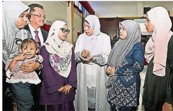
祖莱达（中）关心遇溺消拯员家属日后生活问题。左二为秘书长敏德。

她说，家属所取得援助金胥视消拯员本身是否有投保，在这起事件后，当局鼓励消拯员投保。