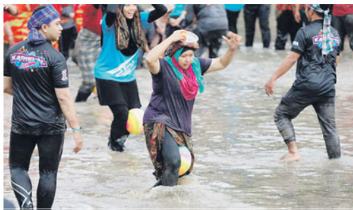
Gelagat salah seorang peserta yang mengambil bahagian.

"Semoga ia dapat melahirkan nilai-nilai murni di kalangan komuniti Shah Alam dan sekaligus menggalakkan amalan hormat-menghormati antara satu sama lain,"katanya.