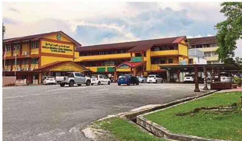
SMA Persekutuan Kajang in Selangor was ordered yesterday to close for two weeks.

A source said the school had been ordered closed to prevent the viral disease from spreading.